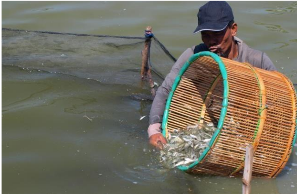
Panen gelondong bandeng 15-20 cm di tambak Desa Patas, Kec. Gerokgak