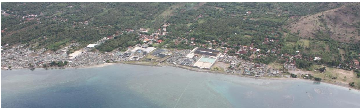
Sepanjang pantai kecamatan Gerokgak: HL & HSRT Bandeng