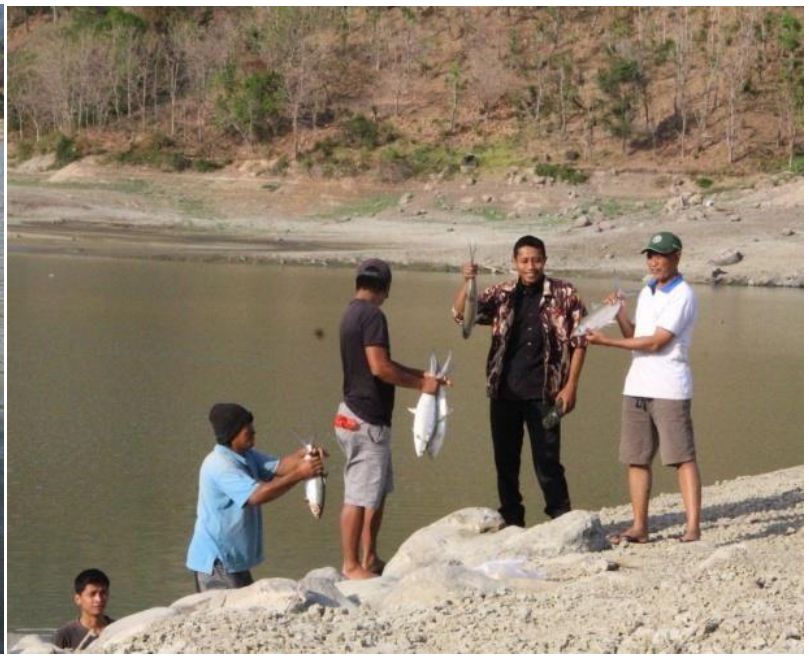
Tangkapan bandeng berat mencapai 1,2 kg. di bendungan Desa Gerokgak