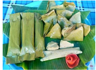
Pepes dan tum