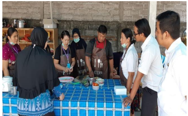
Pembinaan Poklahsar untuk pengolahan bandeng