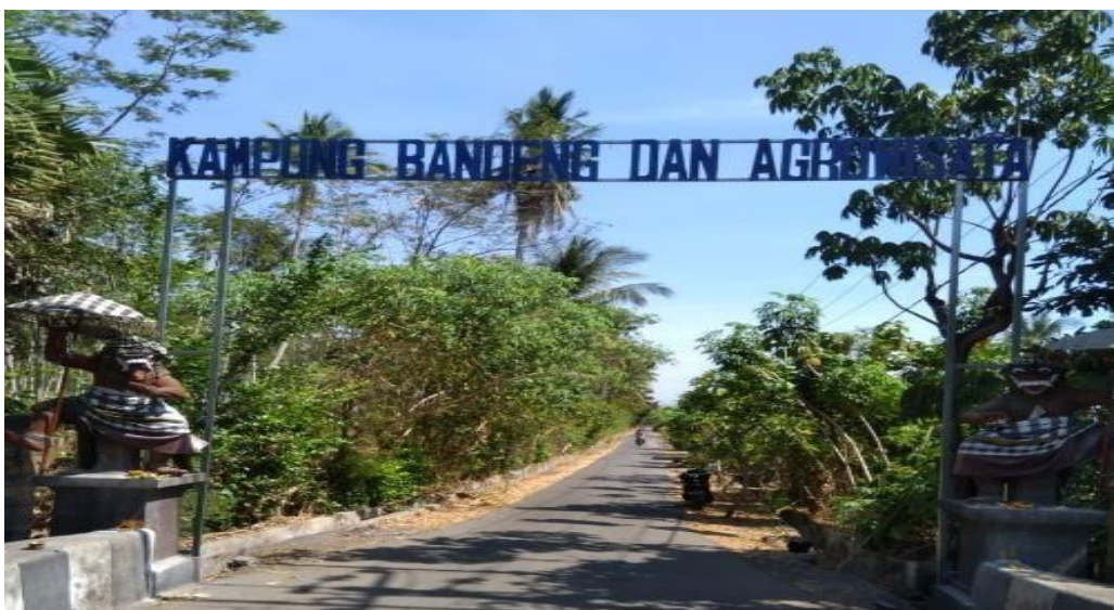
Pintu Masuk dan Pintu Keluar