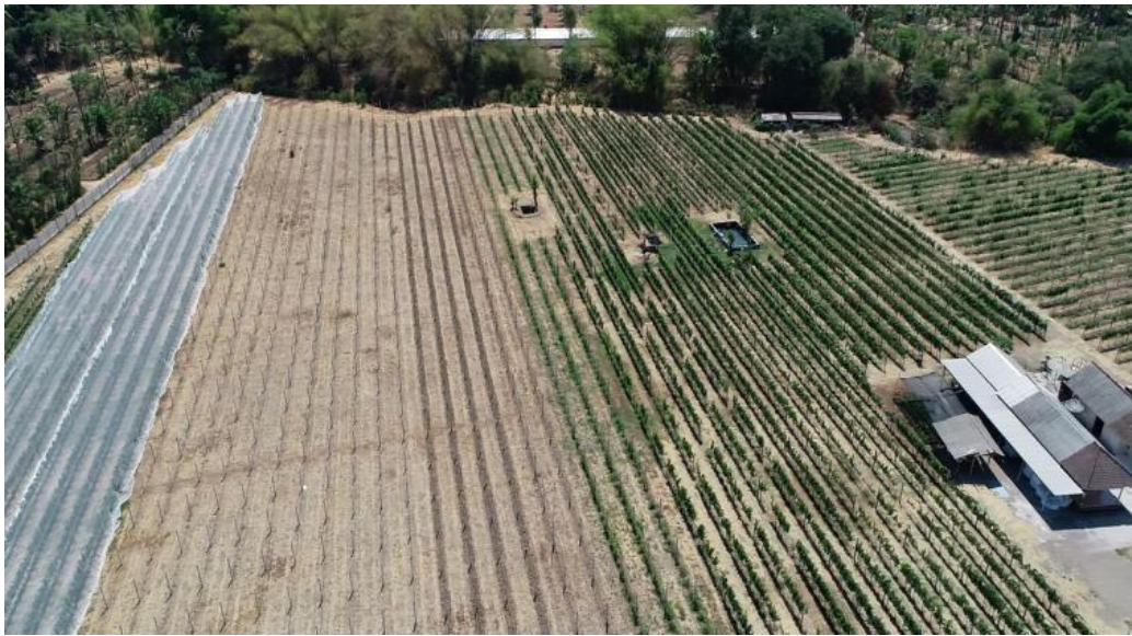
Hamparan wisata kebun anggur

Wisata dan Edukasi / pembelajaran Kebun Anggur Milik Perusahaan Minuman Hatén Wine, dengan berbagai jenis anggur Seperti : Anggur Shiras, Chenin, Belgia dn Colombat dengan luas aeal adalah 13 Ha.