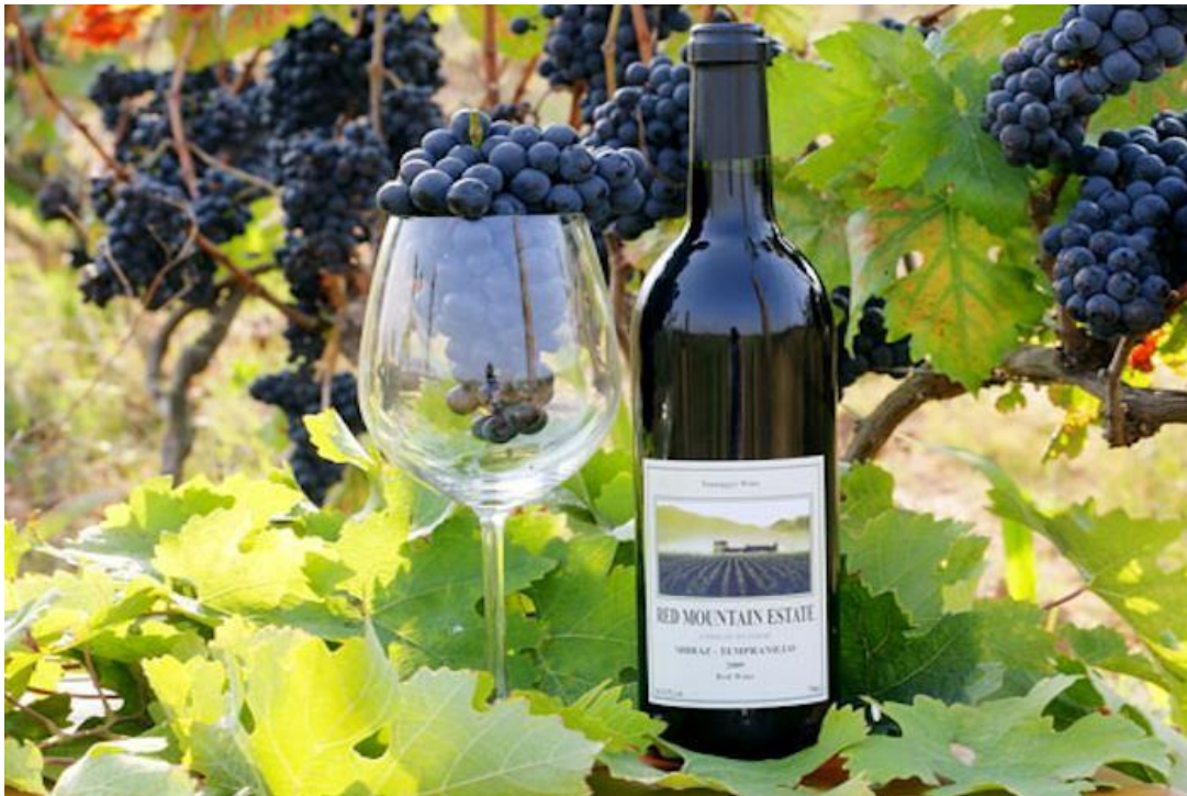
Salah satu produk Hatén wine yang berkualitas